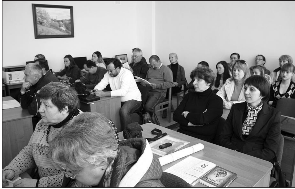
Рис. 5. На засіданні конференції. 11 травня 2017 р.

2000, с. 62). З огляду на сказане, вчений секретар Лубенського музею К.М. Скаржинської С.К. Кульжинський входив до кола дослідників лубенського археологічного осередку вивчення старожитностей Середнього Подніпров'я.