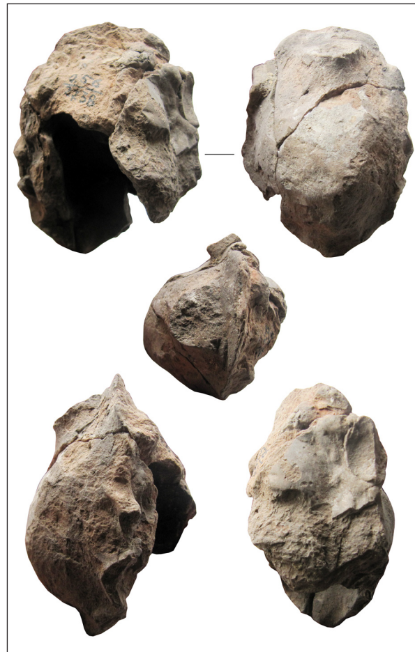
Рис. 4. Фрагментоване погруддя із залишками ліпного вінка, кат. № 9, НФ ІА НАНУ