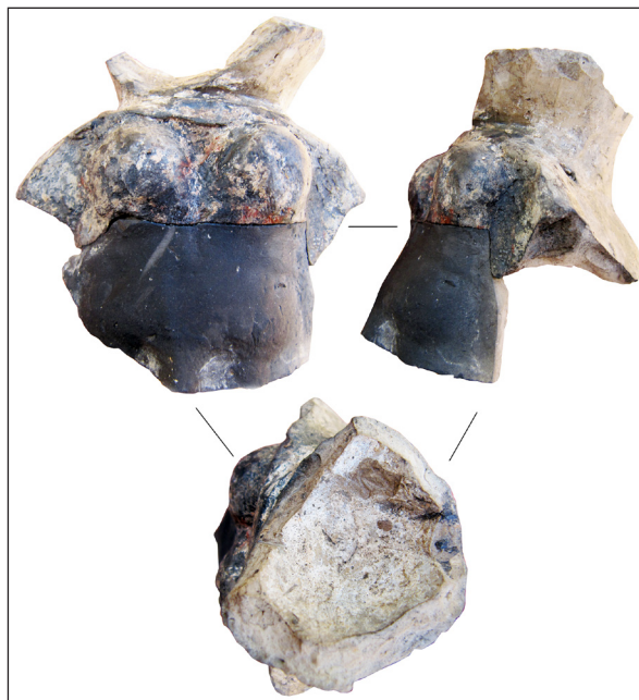
Рис. 8. Фрагмент погруддя-фиміатерія, кат. № 3, НІАЗ «Ольвія»

Утім, стверджувати, що саме Афродіту зображено у вигляді погруддя, немає підстав. Було достатньо інших жіночих персонажів, пов'язаних з Діонісом. Це і смертні Семела й Аріадна, і напівбожественні німфи та менади. Найраніші сцени з Діонісом на чорнофігурних розписах представляють жінок другорядними персонажами. Зважаючи на те, що їх зображено по кілька разом, до того ж, спочатку виключно у супроводі сатирів, їх аргументовано вважають німфами чи менадами (Carpenter 1986, p. 76—82). У контексті інтерпретації ольвійських погрудних зображень, слід звернути увагу на атрибути й особливості їхніх зображень. Вазописці VI ст. до н. е. зображали учасниць фіасу з довгим