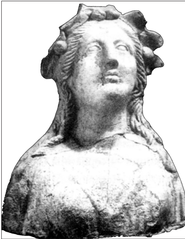
Рис. 5. Фрагментоване погруддя-фіміатерій з ліпним вінком, знайдене в Гермонассі (за: Коровина 2002)