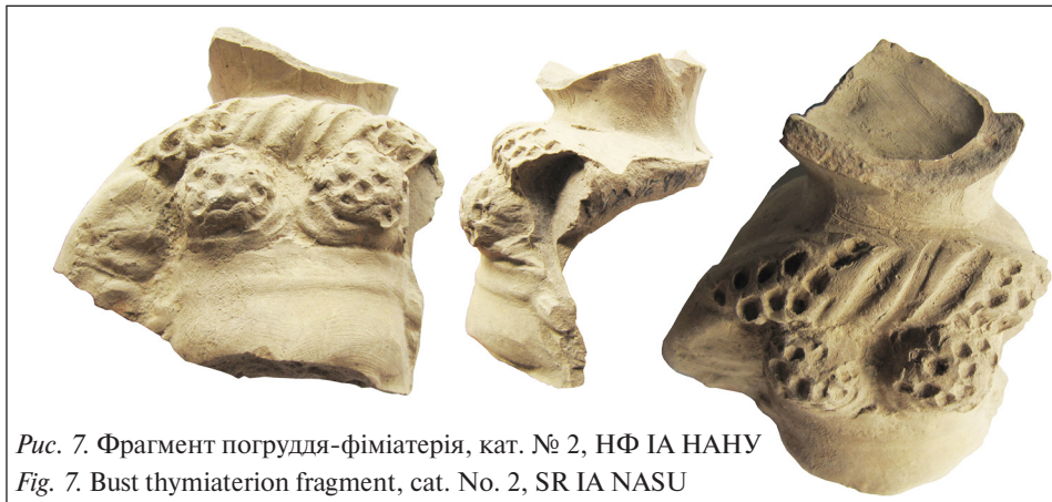
Рис. 7. Фрагмент погруддя-фіміатерія, кат. № 2, НФ ІА НАНУ Fig. 7. Bust thymiaterion fragment, cat. No. 2, SR ІА NASU

на серії подібних погрудь узгоджуються з цим датуванням і дозволяють віднести їх до першої половини II ст. до н. е.