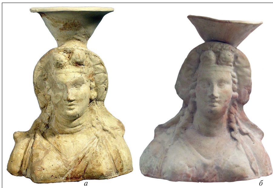
Рис. 1. Погруддя-фіміатерії із зображенням персонажа діонісійського кола: а) ділянка И, НМІУ (Національний... 2011); б) стоя на ділянці E2, Музей археології ІА НАНУ