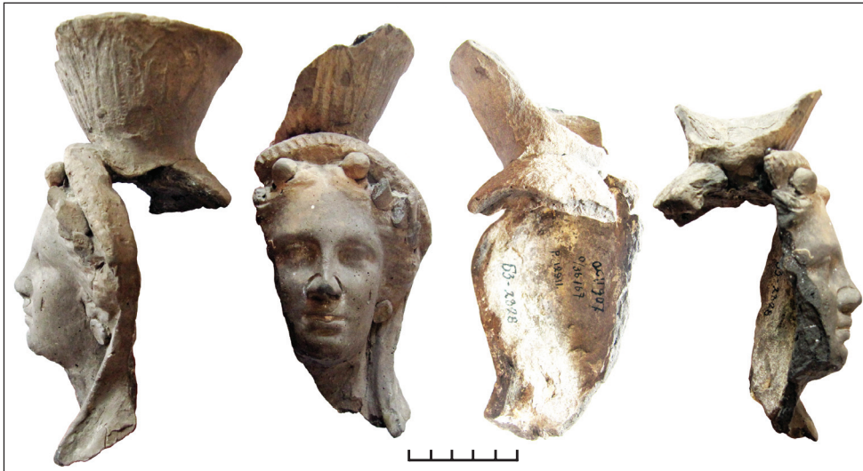
Рис. 3. Погруддя-фіміатерій з ліпними деталями й орнаментованою чашею, кат. № 8, НМІУ