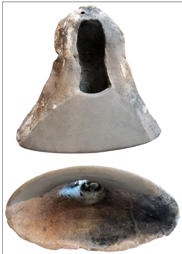
Рис. 6. Фрагментоване погруддя-фіміатерій, кат. № 1, НМІУ, зворот і вигляд знизу