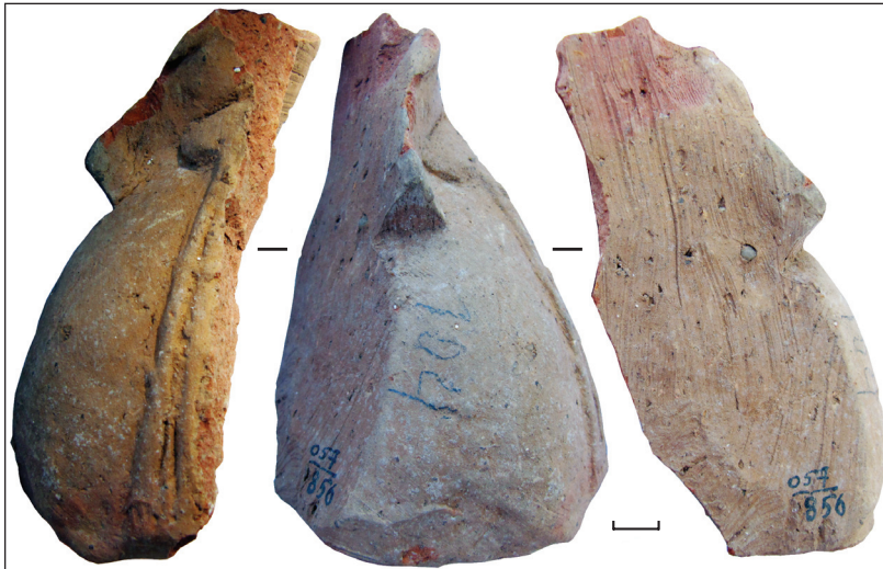
Рис. 11. Фрагмент погруддя-фіміатерія, кат. № 6, НФ ІА НАНУ Fig. 11. Bust thymiaterion fragment, cat. No. 6, SR IA NASU

персонаж. До того ж, найчастіше вона напівголена, без будь-яких атрибутів (Carpenter 1997, р. 65; Глушек 2011, с. 101). Маючи на увазі ці міркування, трактувати зображення на ольвійських погруддях як Аріадну стає не зовсім правомірно. Фіміатерії зображують відокремленого персонажа. Невідомо, чи це була Аріадна, чи Семела, а можливо й Бастилина, дружина афінського Бастилевса, яка щороку на Анфестеріях «одружувалася» з Діонісом на агорі.