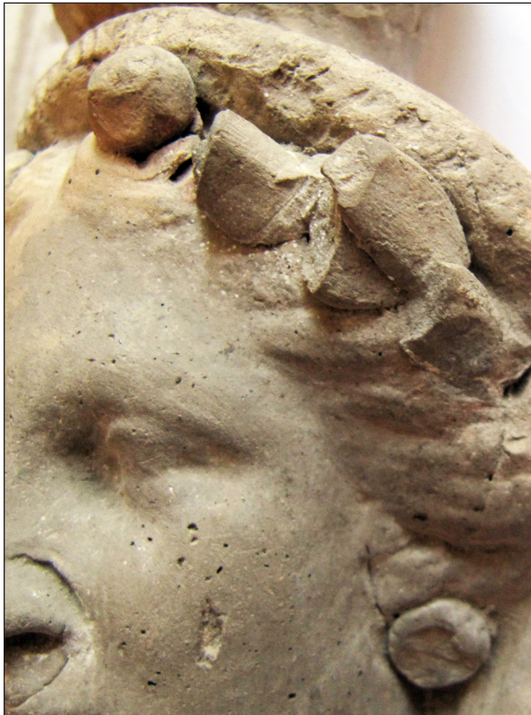
Рис. 13. Деталь погруддя-фіміатерія з ліпними елементами, кат. № 8, НМІУ