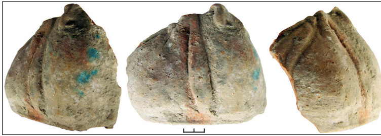
Рис. 9. Фрагмент погруддя-фіміатерія, кат. № 4, НФ ІА НАНУ