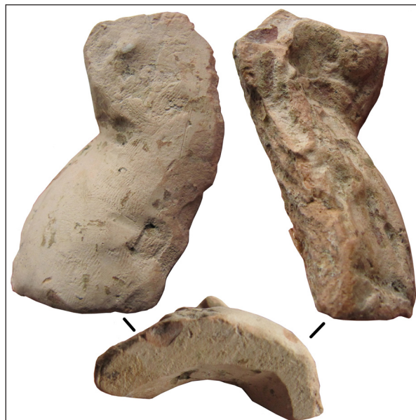
Рис. 12. Фрагмент погруддя-фіміатерія, кат. № 7, НФ ІА НАНУ Fig. 12. Bust thymiaterion fragment, cat. No. 7 SR IA NASU

Таким чином, найпевніше буде називати персонажа розглянутих погрудь-фіміатеріїв учасником фіаса Діоніса. Адже ми не знаємо, чи перед нами німфа, чи Аріадна, Семела та ін., чи сам Діоніс.