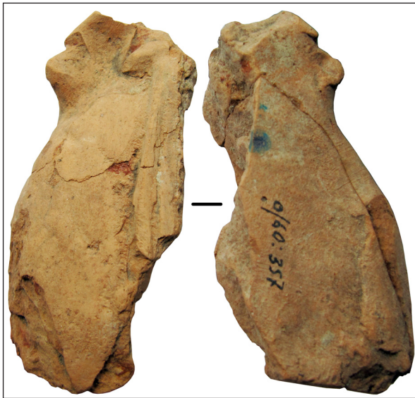
Рис. 10. Фрагмент погруддя-фіміатерія, кат. № 5, НФ ІА НАНУ