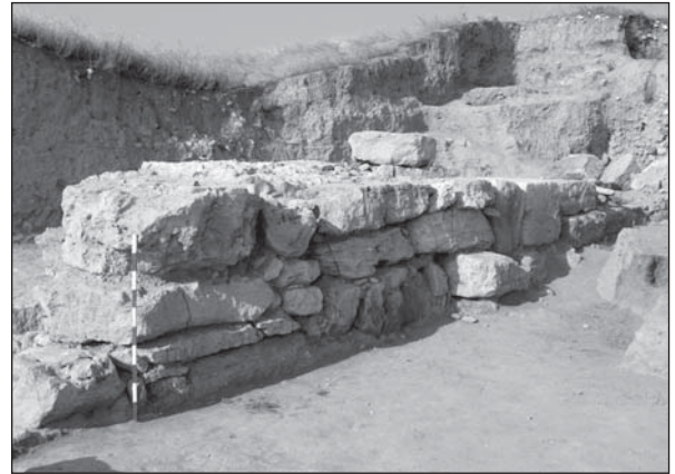
Рис. 7. Оборонний мур північної стіни римської цитаделі. Розкопки Д.М. Хмелевського, наукове керівництво С.Д. Крижицького

Окремо слід згадати реставрацію крепіді навколо кургану зі склепом Єврисивія та Арети II ст. н.е. Реставраційним роботам за спеціально розробленим проектом передували додаткові археологічні дослідження по трасі крепіді з метою виявлення стародавніх фундаментів та вивчення їхнього стану, а також наукове