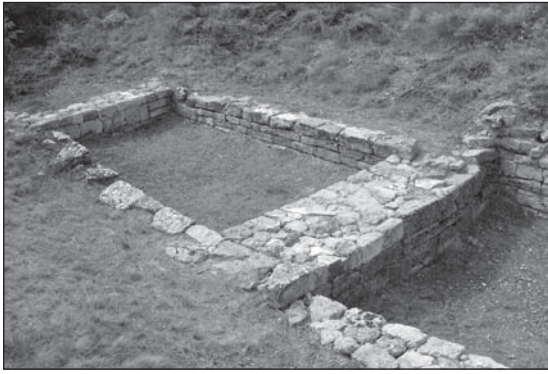
Рис. 11. Південне приміщення Східного торговельного ряду

щень, подекуди зникло мурування поперечних стін, а загальний незадовільний стан об'єкта доповнила маса землі, яка напливла з високих бортів розкопу до приміщення та на залишки мурування (рис. 9).