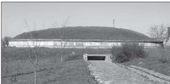
Рис. 6. Курган Єврисивія та Арети — реконструкція крепіді та насипу

ваними керамічними фрагментами так, щоб повністю відтворити план храму (рис. 5). Щорічно ділянка теменосу підновлюється саме в такому вигляді й це не потребує додаткових фінансових або фізичних витрат.