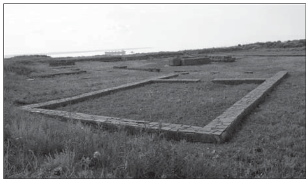
Рис. 4. Храм Зевса на Східному теменосі — приклад макетування плану

ну будівлі, мурування як у підвалах, так і в наземних приміщеннях (Беляєв, Кудренко 1994, с. 103 сл.; Беляєв 1995, с. 43—45). Практично всі об'єкти Верхнього міста вже зараз залучено до екскурсійних маршрутів заповідника, на черзі — об'єкти Нижнього міста (Беляєв 2003, с. 53—54; Беляєв 2004, с. 58—59). Необхідно додати, що методику консервації будівельних комплексів, яка пройшла успішну апробацію в Ольвії, було враховано під час проведення аналогічних заходів на другій за значенням пам'ятці античного часу Північно-Західного Причорномор'я — у Тірі (Беляєв, Росохацкий 1999, с. 52 сл.).