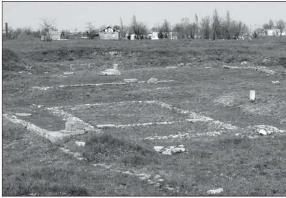
Рис. 5. Храм Аполлона Лікаря на Західному теменосі — приклад експонування плану за допомогою черепків