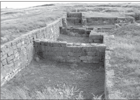
Рис. 2. Підвали Західного торговельного ряду на ольвійській агорі

яких був відсутній камінь, виявився цілком позитивним (див. детал.: Беляєв, Кудренко 1994, с. 103—104). Окрім того, мурування піднімалося на певну висоту (проте не вище від максимально збереженого на момент розкопок), відновлювалися дверні коробки, вікна в підвальних приміщеннях, докладалися розбиті або втрачені фрагменти вимощення, обрамлення цистерн у подвір'ях, сходи в підвальних приміщеннях. У роботах використано автентичний оброблений камінь, що походить із розкопок (часто — той, що випав із стін), без застосування сучасного матеріалу, який дисонував би у фасадах мурування. Таким чином було законсервовано низку об'єктів і будівельних комплексів, яким повернуто початковий вигляд, зафіксований на момент розкопок. Практичним досвідом установлено, що в умовах під відкритим небом подібні роботи слід повторювати з періодичністю до 25 років (Крижицький 2001, с. 32). Це, перш за все, стосується будинків, відкритих у Нижньому та Верхньому містах (рис. 2; 3), в яких підновлено або відтворено, відповідно до пла-