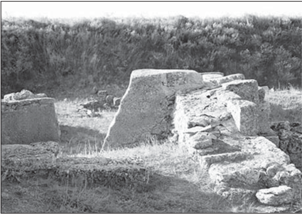
Рис. 1. Будинок на ділянці А — приклад консервації 1960-х рр.