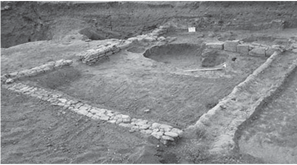
Рис. 13. Комплекс громадського (?) призначення в Борисфені станом на 2014 р., після закінчення консерваційних заходів

споруд повністю відкрито в 1987 р. За час, що минув, частково було зруйноване фундаментне та наземне мурування храму та огорожі, викришилося глиняне забутовування вівтаря. У результаті консерваційних заходів було докладено два ряди двофасадного мурування північної стіни храму, завдовжки 4,5 м, заввишки 0,4 м та завширшки 0,6 м. За цією системою було викладено зруйновану південну стіну. Східну й західну стіни наосу законсервовано до висоти 0,3 м, відновлено зруйновані анти — на торцеві стіни встановлено пласкі прямокутні плити (розміри: 0,5 × 0,3 м та 0,5 × 0,5 м, відповідно). Також відновлено огорожу, а плити вівтаря скріплено розчином (рис. 12).