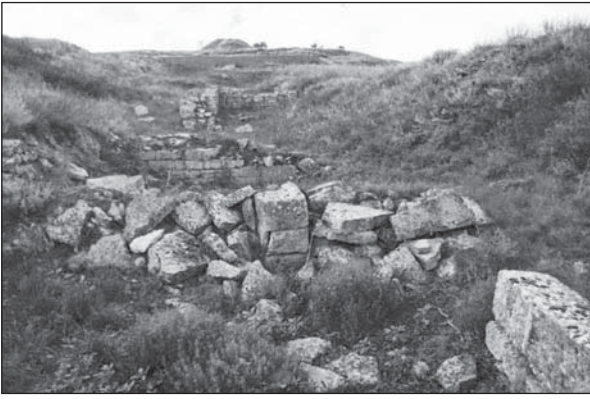
Рис. 9. Східний торговельний ряд. Загальний вигляд із півдня станом на 2013 р., до проведення консерваційних заходів

вабливості. Залишати такі споруди для експозиції не рекомендовано (Крижицький 2001, с. 30). Саме тому вони засипаються відпрацьованим ґрунтом опісля їхньої фіксації, а через рік — остаточно нівелюються внаслідок осідання в зимовий період. Таким чином досягається консервація будівельних решток у поєднанні з музеєфікацією пріоритетних об'єктів. На жаль, сучасними методами консервації не вдається зберегти такі монументальні земляні споруди, як підземні склепи ольвійського міського некрополя, які б склали досить ефектну частину експозиції. Зараз усі вони після відкриття та фіксації також засипаються відпрацьованим ґрунтом.