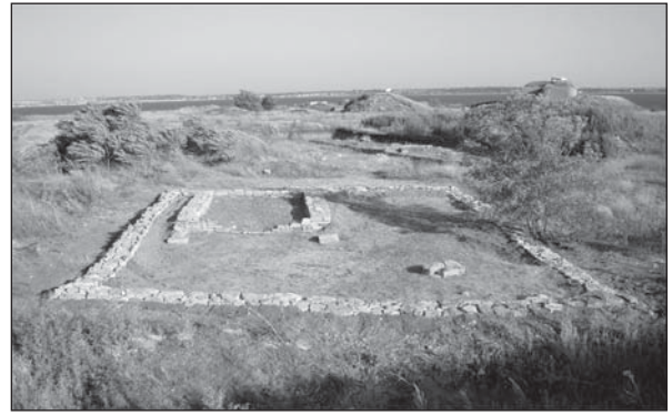
Рис. 12. Теменос Афродіти в Борисфені станом на 2014 р., після закінчення консерваційних заходів

У другому південному приміщенні збережене мурування виведено на одну висоту, прак-