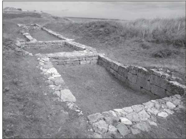
Рис. 10. Східний торговельний ряд. Загальний вигляд з півдня станом на 2015 р., після закінчення консерваційних заходів

Реалізовані за останні десятиліття методичні рекомендації були враховані для наукового обґрунтування невідкладних заходів, спрямованих на охорону об'єктів археологічної спадщини, що зберігаються на території НІАЗ «Ольвія» і до цього часу не були залучені до екскурсійних маршрутів заповідника з причи-