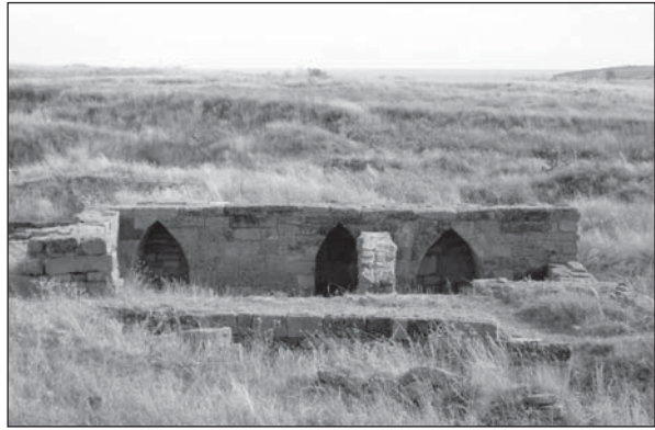
Рис. 3. Стіна з нішами будинку «жерця Агрота» в Центральному кварталі

яких був відсутній камінь, виявився цілком позитивним (див. детал.: Беляєв, Кудренко 1994, с. 103—104). Окрім того, мурування піднімалося на певну висоту (проте не вище від максимально збереженого на момент розкопок), відновлювалися дверні коробки, вікна в підвальних приміщеннях, докладалися розбиті або втрачені фрагменти вимощення, обрамлення цистерн у подвір'ях, сходи в підвальних приміщеннях. У роботах використано автентичний оброблений камінь, що походить із розкопок (часто — той, що випав із стін), без застосування сучасного матеріалу, який дисонував би у фасадах мурування. Таким чином було законсервовано низку об'єктів і будівельних комплексів, яким повернуто початковий вигляд, зафіксований на момент розкопок. Практичним досвідом установлено, що в умовах під відкритим небом подібні роботи слід повторювати з періодичністю до 25 років (Крижицький 2001, с. 32). Це, перш за все, стосується будинків, відкритих у Нижньому та Верхньому містах (рис. 2; 3), в яких підновлено або відтворено, відповідно до пла-