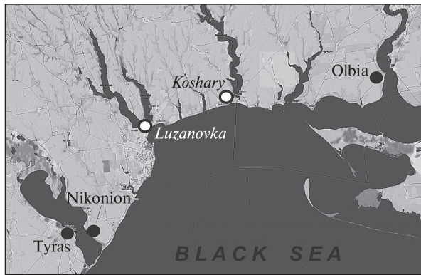
Fig. 3. Location of Koshary and Luzanovka

— Cyzicus (or Kyzikos) — hoard of electrum staters.