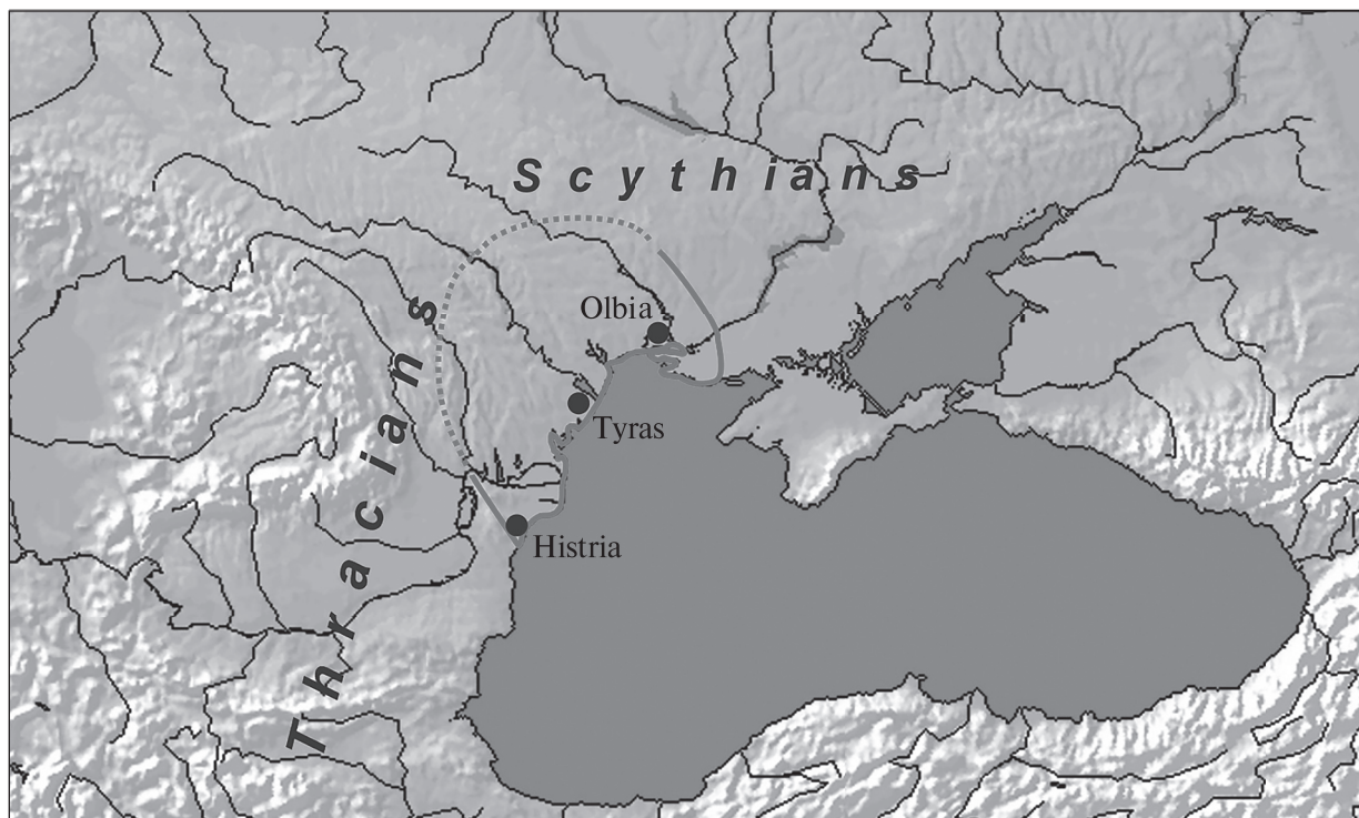
Fig. 1. North-Western Black Sea Region

craft production, while on the other hand it was the raw farm products, mainly grain (Бруяко, Секерская 2016, с. 201—202).