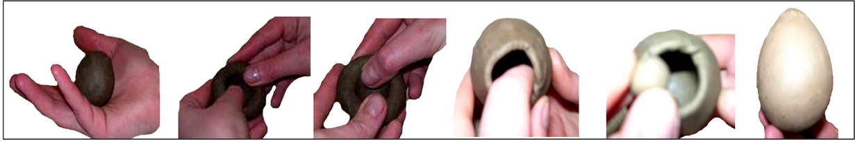
Рис. 1. Реконструкція виготовлення керамічних полив'яних писанок