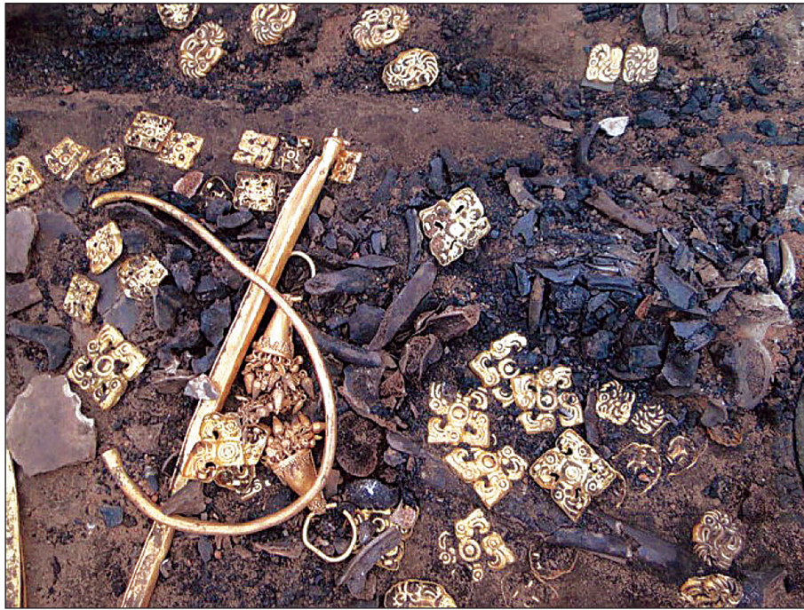
Рис. 2. Золоті гривна та бляшки головного вбрання у сакському жіночому похованні, V ст. до н. е., мог. Таксай 1, курган 6, поховання 3, Казахстан (за: Золото властелинов 2018, с. 137)