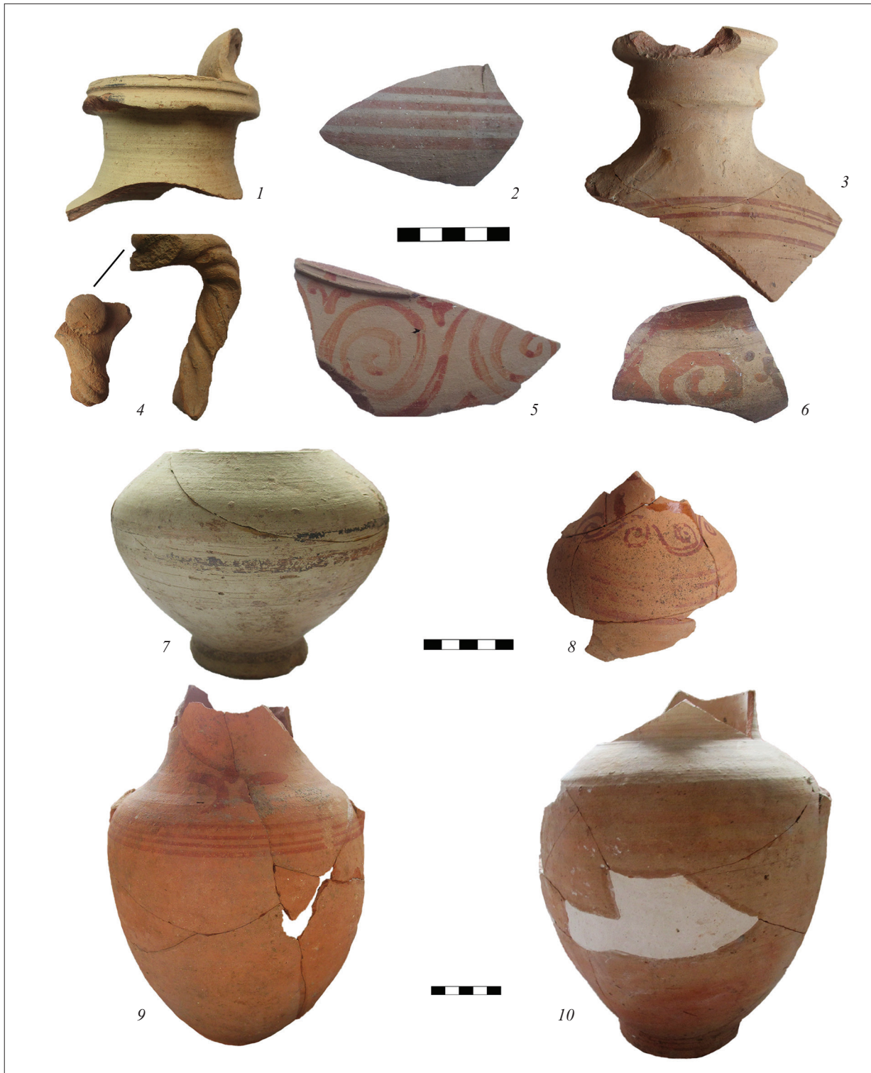
Рис. 1. Елліністична кераміка з Ольвії: 1 — вінця глека (О-67/573); 2 — стінка глека зі смугастим орнаментом (О-65/421); 3 — фрагмент фляги (АГД/О-72/181/2); 4 — ручка глека з наліпом (О-56/4490); 5, 6 — стінки глеків із рослинним орнаментом (О-66/857; О-64/1846); 7 — частина глека малих розмірів зі смугастим орнаментом (О-63/1193); 8 — частина глека малих розмірів із рослинним орнаментом (О-71/806); 9, 10 — орнаментовані глеки великих розмірів (АГД/О-74/457; АГД/О-75/144)

Fig. 1. Hellenistic ceramics from Olbia: 1 — a rim of the jug (O-67/573); 2 — a wall of the jug with a striped ornament (O-65/421); 3 — a fragment of the flask (АГД/О-72/181/2); 4 — a handle of the jug with a convex part in the shape of a flat circle (O-56/4490); 5—6 — walls of jugs with floral ornaments (O-66/857; O-64/1846); 7 — a part of the small jug with a striped ornament (O-63/1193); 8 — a part of the small jug with floral ornament (O-71/806); 9, 10 — ornamented large jugs (АГД/О-74/457; АГД/О-75/144)