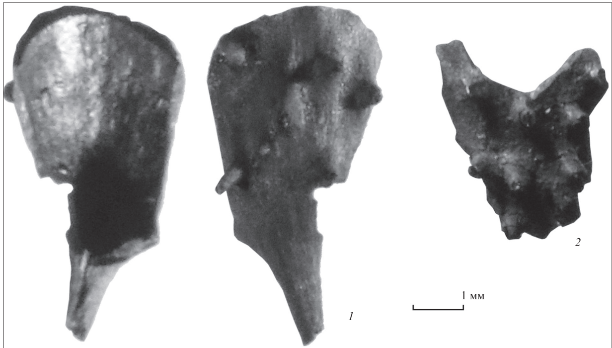
Рис. 2. Нетреба з Більського городища, макрорештки