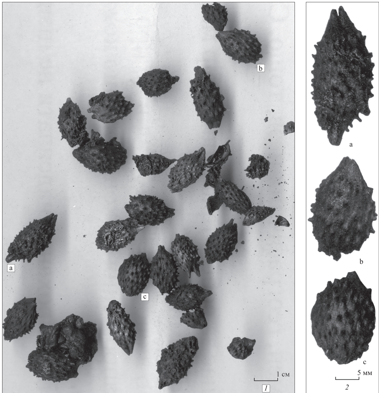
Рис. 4. Нетреба з давньоруського городища Манжелія: 1 — загальний вигляд; 2 — кілька прикладів плодів Fig. 4. Cocklebur from the ancient Rus hill-fort of Manzheliia: 1 — general view; 2 — some examples of fruits in details

ництво також вказують знахідки квітів нагідок і плодів нетреби звичайної. Перших збереглося відносно небагато; вважаємо, що це насамперед пов'язано з їхньою крихкістю. А от плодів нетреби налічувалось кілька десятків. Це свідчить про цілеспрямоване (а не випадкове) потрапляння цих частин рослин до житла. Обидві вказані рослини мають цілющі властивості, їх і досі використовують у традиційній медицині (Чопик, Дудченко, Краснова 1983).