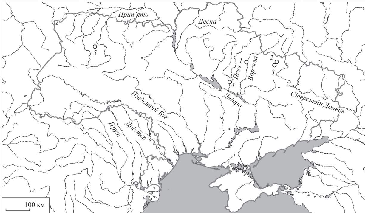
Рис. 1. Карта знахідок нетреби на території сучасної України. Пам'ятки скіфського часу: 1 — Більськ; 2 — Циркуни; 3 — Новоселівка; давньоруські пам'ятки: 4 — Манжелія; 5 — Пересопниця