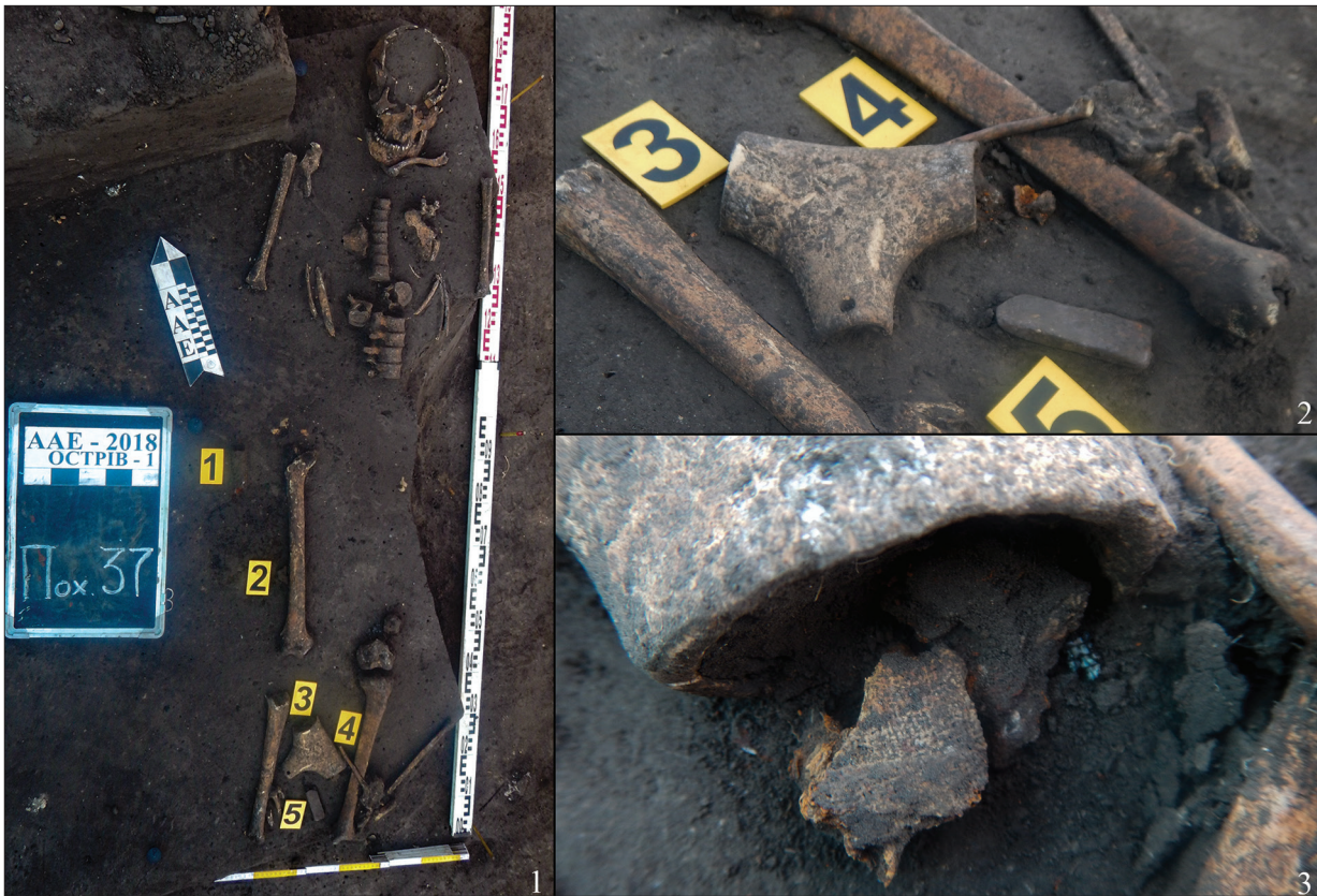
Рис. 1. Поховання 37. Польові фото: 1 — загальний вигляд; 2 — місце розташування рогового контейнера; 3 — рештки залізної пластини і тканини.