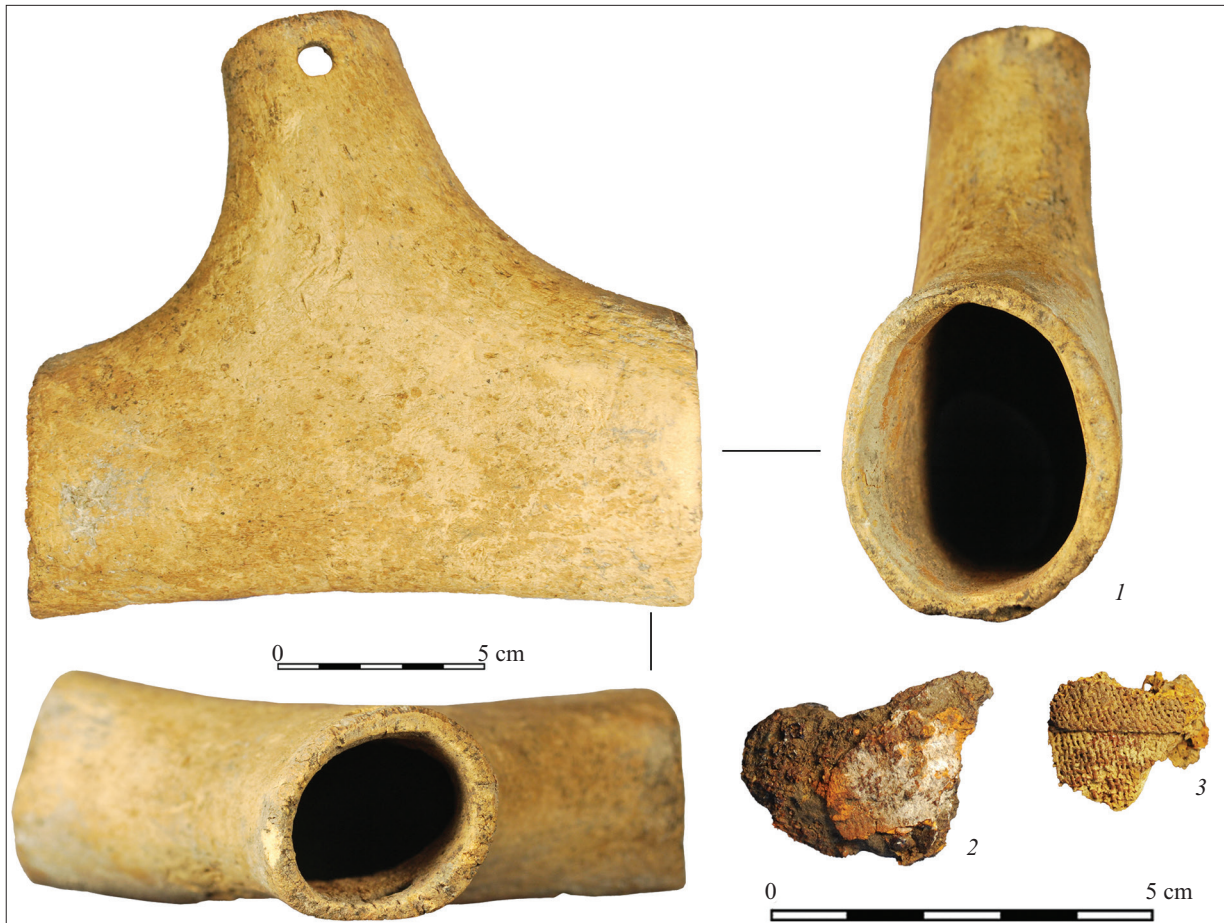
Рис. 3. Фото: 1 — Т-подібний контейнер, 2 — залізна пластина; 3 — тканина. Fig. 3. Antler item. Photo: 1 — a T-shaped container, 2 — an iron plate; 3 — fabric.

слов'янських поховальних пам'яток, помітила, що Т-подібні ємності трапляються тут переважно в могилах чоловіків та хлопчиків, тоді як Y-подібні — тільки в жіночих. Вона припускала, що там могли міститися специфічні лікарські трави чи мазі. У випадку чоловіків це, імовірно, засоби для полегшення болю або загоєння ран чи речовини, що підвищували потенцію. Відповідно, Y-подібні екземпляри символізували нижню частину жіночого тіла й містили трави або речовини, призначені для підвищення жіночої репродуктивної спроможності. На підтвердження цієї гіпотези дослідниця навела низку своєрідних орнаментів на поверхні виробів (Schulze-Dörrlamm 2001, S. 544).