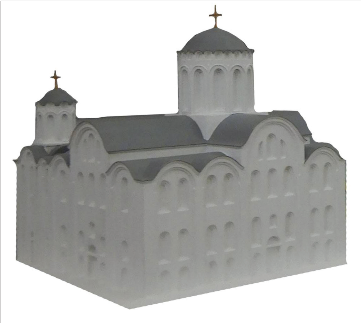
Рис. 6. Макет Успенського собору Києво-Печерської лаври XI ст. Реконструкція М. В. Холостенка (Національний заповідник «Києво-Печерська лавра», інв. № КПЛ-СК-НДФ-30)