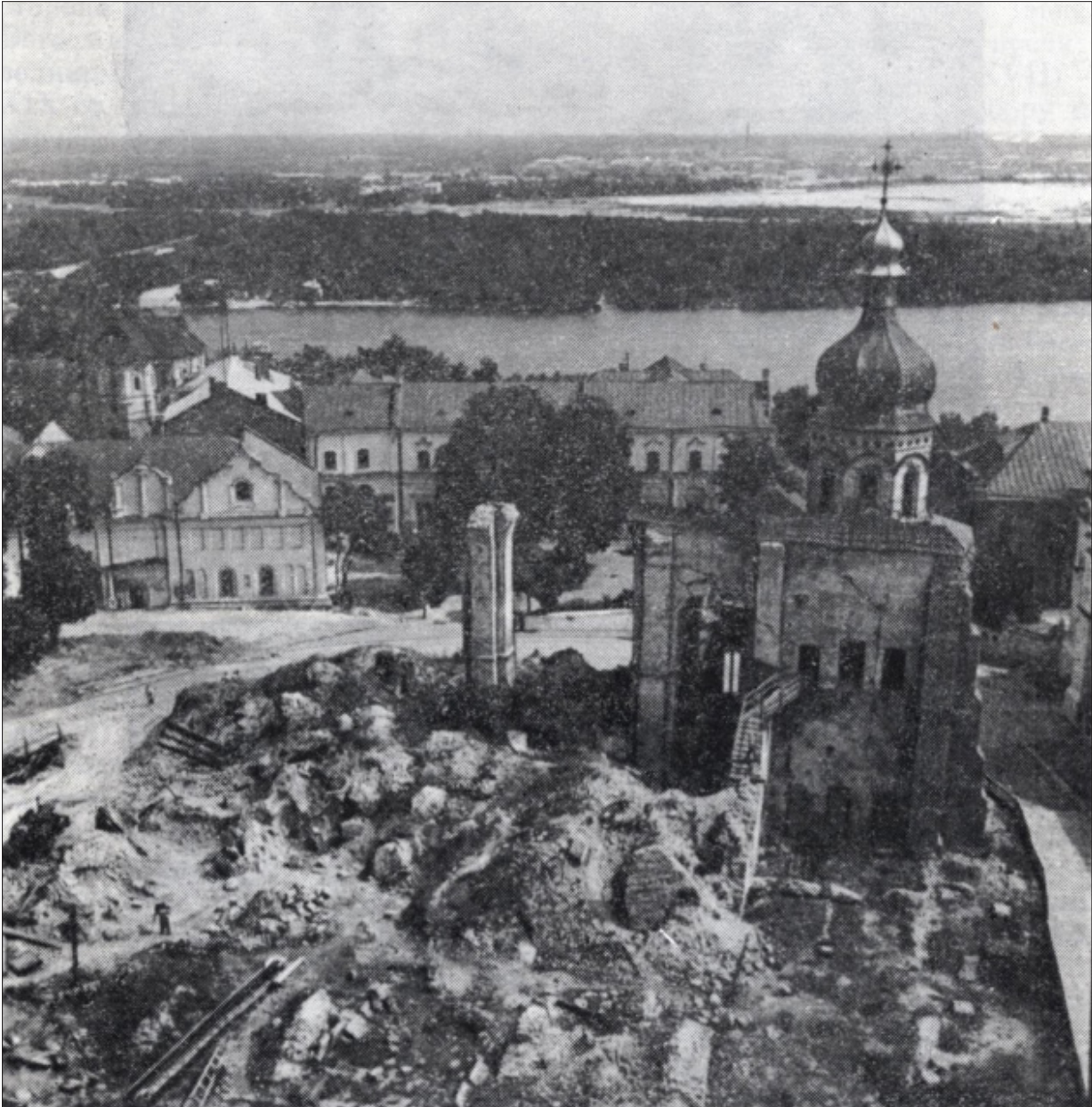
Рис. 4. Руїни собору, фото 1956 р. (за: Холостенко 1975, рис. 2)