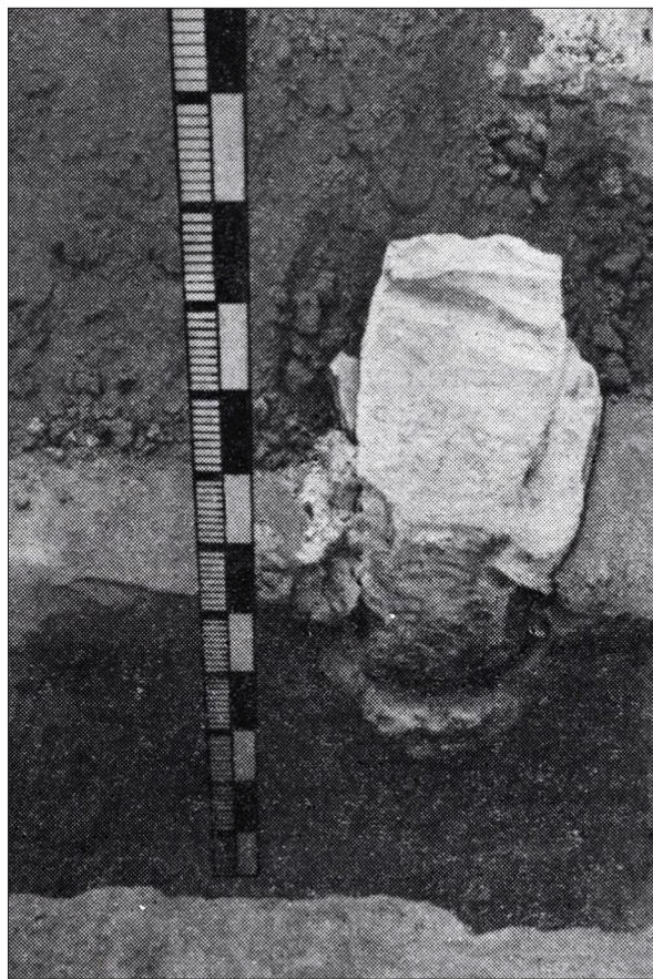
Рис. 5. «Камінь основи» (за: Холостенко 1975, рис. 20) Fig. 5. "Foundation Stone" (after: Холостенко 1975, fig. 20)

Матеріали, виявлені під час досліджень, надали Миколі В'ячеславовичу інформацію для реконструкції архітектурної історії собору. З'ясовано, що до структури південної стіни