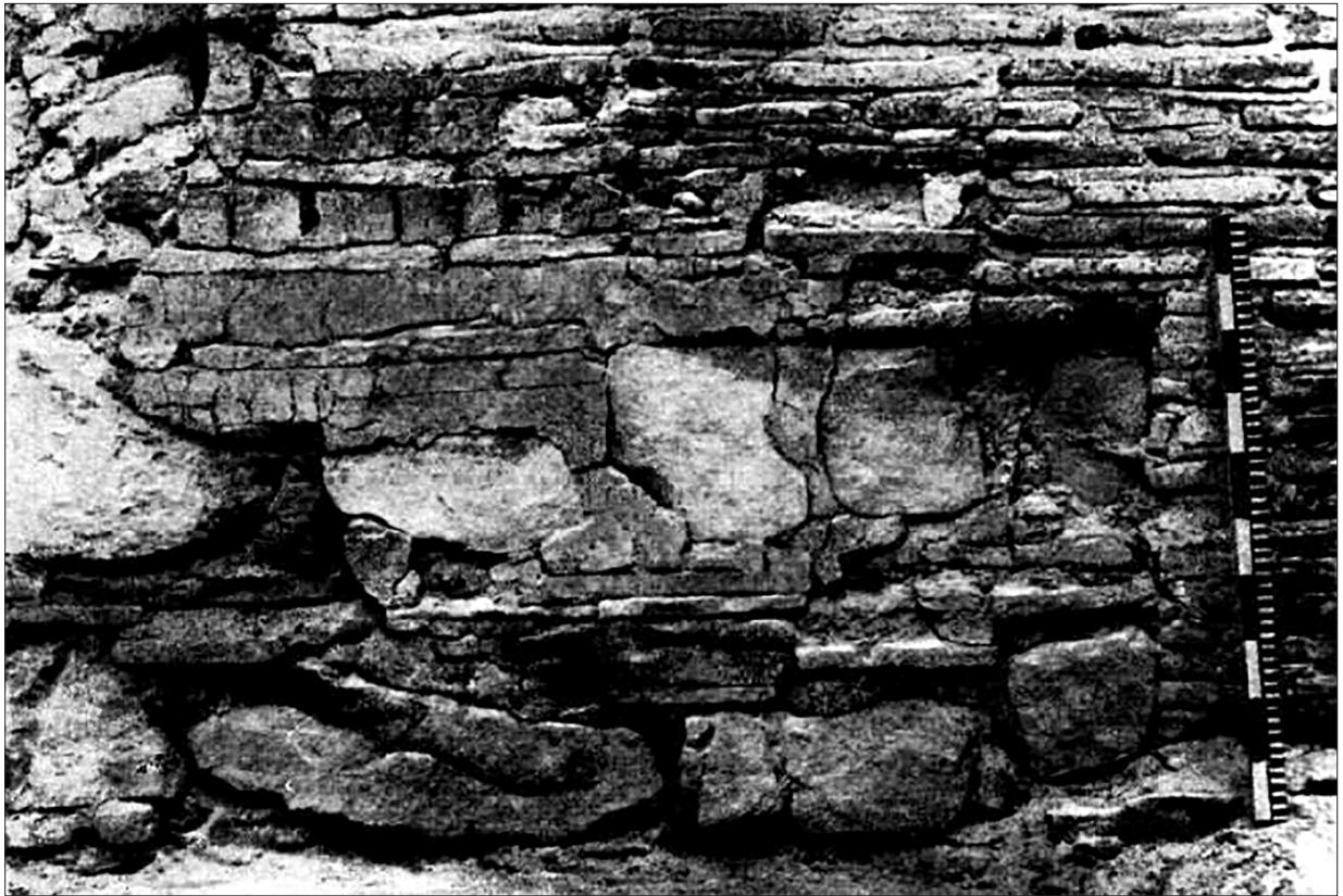
Рис. 3. Частина південної стіни Успенського собору (ліворуч — мурування XI ст., праворуч — кладка XIII ст.) (за: Холостенко 1955, рис. 10)