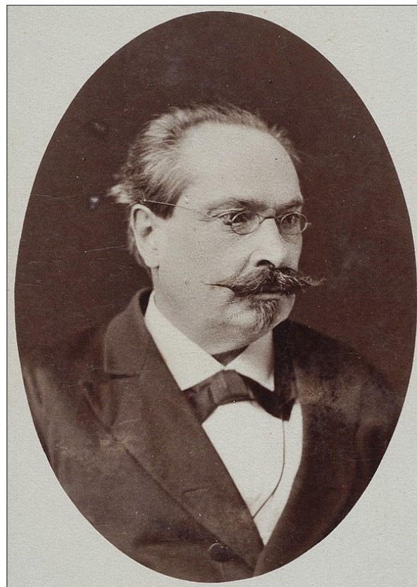
Рис. 1. Адам Кіркор (1818—1886) (за: Булик 2020, рис. 4) Fig. 1. Adam Kirkor (1818—1886) (after: Булик 2020, fig. 4)

Серед відкритих пам'яток були й такі, які містили розписний посуд. А. Кіркор відніс їх до культури «язичницького» часу, проте не дав їй назви. Сьогодні ці пункти відомі як трипільські, їх ми розглянемо детальніше. З огляду на усталену термінологію, саме трипільськими ми називаємо ці пам'ятки у тексті.