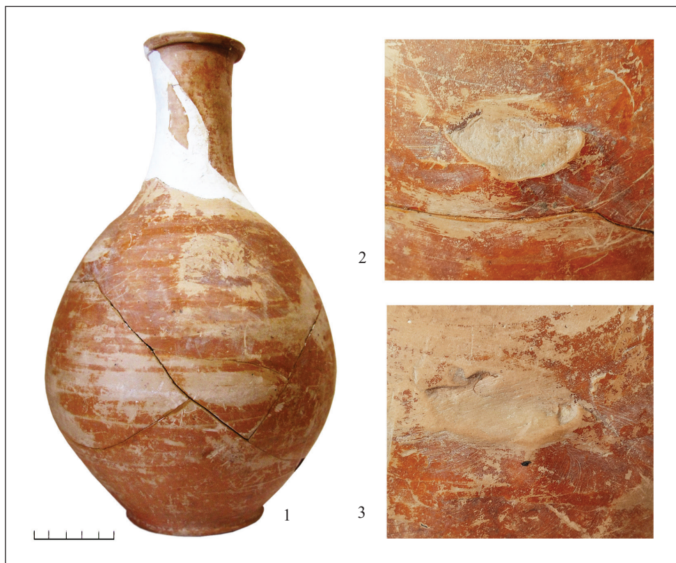
Рис. 2. Червонолакова столова амфора з поховання в Нетеребці: 1 — сучасний вигляд; 2, 3 — рештки нижнього кореня ручок