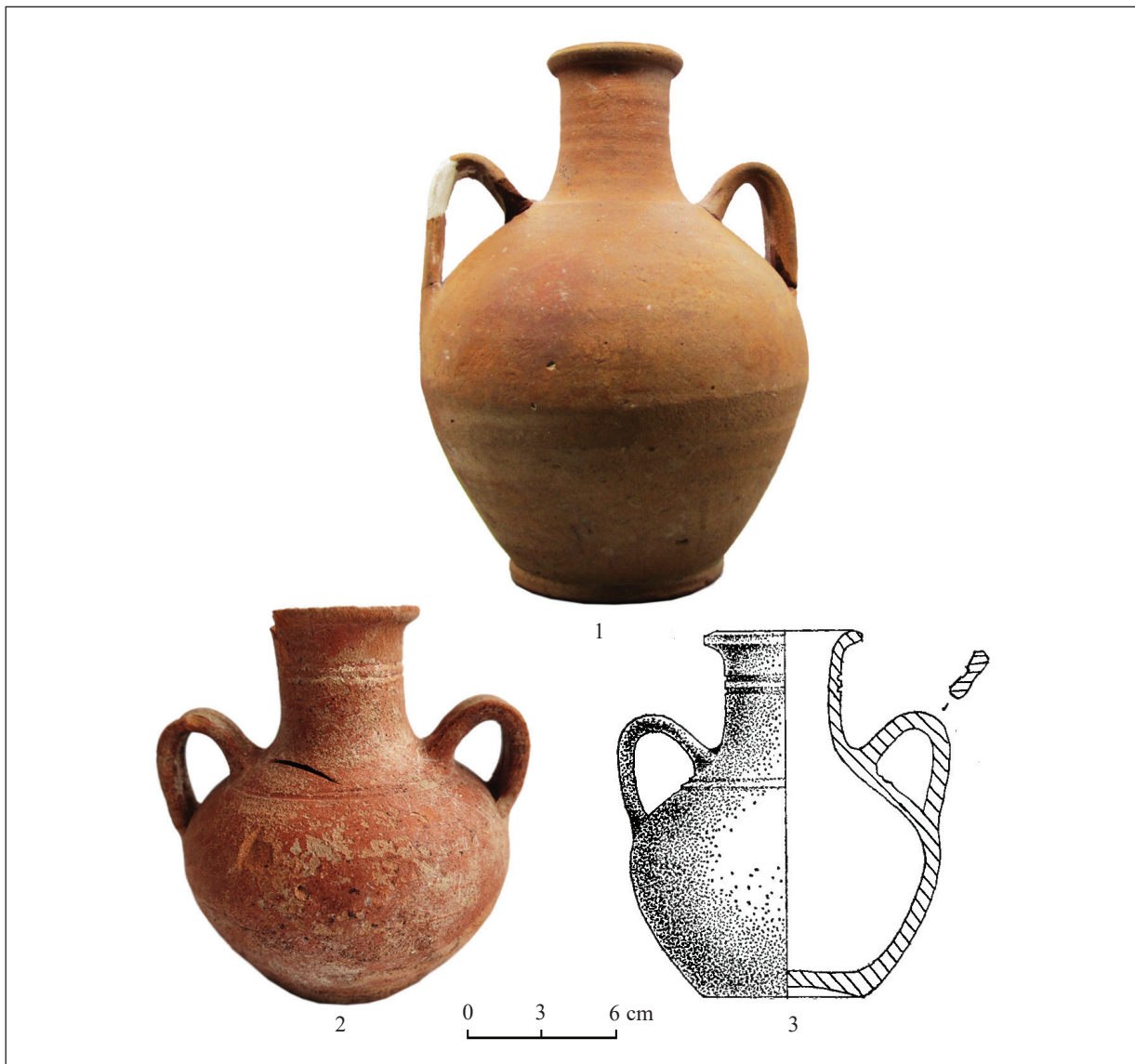
Рис. 4. Столові амфори іншого типу із сарматських поховань: 1 — Новопилипівка, курган 2; 2, 3 — Золоте, могила 8 (1, 2 — фото автора; 3 — за Корпусова 1983)